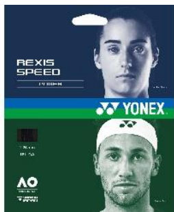
レクシススピード 125

柔らかさの中にもしっかりと芯が感 じられる打感のガットです。性能が 比較的長続きするのもポイント!!