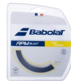
RPM プラスト 125

柔らかめの打感、反発性能もあり、 球速&バウンド後の伸びの出しやす さが特徴的なガットです。