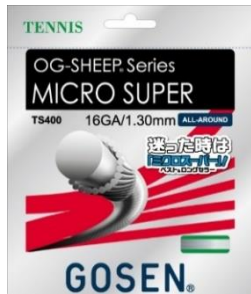
マイクロスーパー 1.30

耐久性/反発/球速のバランス良好 低価格なのでコストパフォーマンス にも優れています。