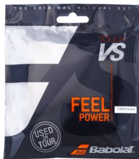
タッチ VS 130

反発性能と、ナチュラルならではの ホールド感、テンション維持◎ どなたでも一度はお試してください！