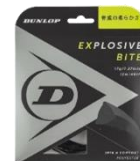
エクスプロッシブ バイト 1.27