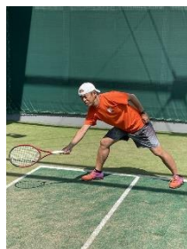
② 相手の体制が崩れた時