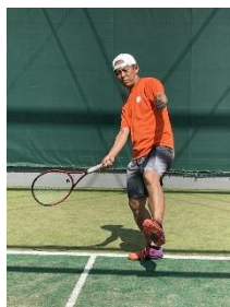
① 相手が下がった時