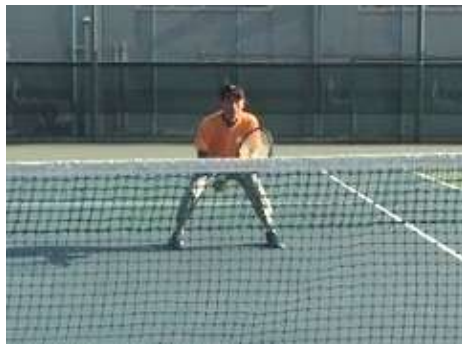
ワイドスタンス & 低い姿勢