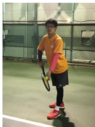
【左に狙う体の向き】