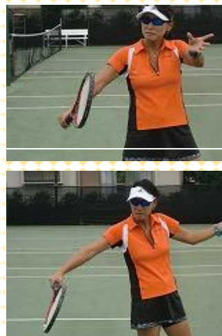
サービスライン前後

スイングボレー：インパクトまではスライスボレーと同じ。ボールの飛距離を出すために肩から動かし目標方向に面を押し出す。