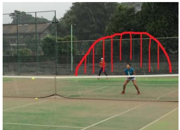
危険な空間は意外と狭い

※前衛の守備範囲は、男女・右利き左利き・身長等 個人差が大きいため、よく観察しましょう。