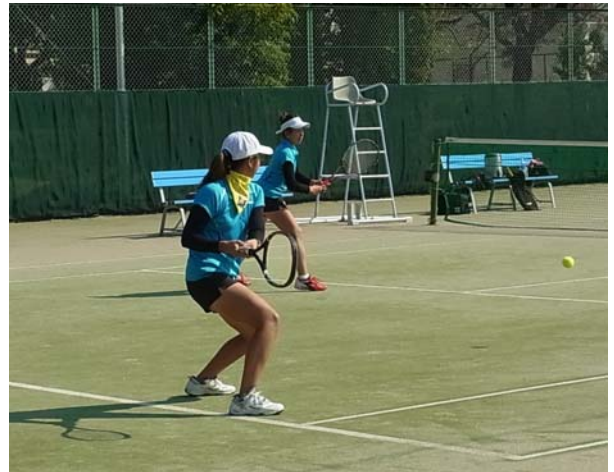
コンパクトなテイクバック

素早く、コンパクトなテイクバックが重要 小さな上体のターンからブロックレシーブ フォロースルーもコンパクトに！ 腕やラケットを大きく後ろに引くことは ミスの原因となります。